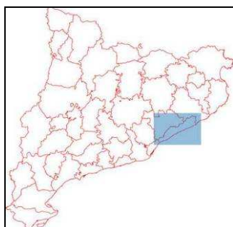
Taula 5.1. Límits comarcals i terme municipal de Sant Vicenç de Montalt.

El terme municipal limita al nord i nord-est amb Arenys de Munt, a l'est amb Arenys de Mar i Caldes d'Estrac, al sud-est amb la mar mediterrània, a l'oest amb Sant Andreu de Llavaneres i al nord-oest amb Dosrius, tots ells municipis de la comarca del Maresme.