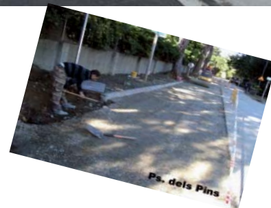
Ps. dels Pins