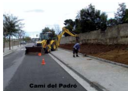
Camí del Padró