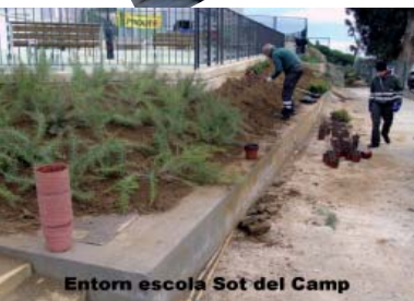
Entorn escola Sot del Camp