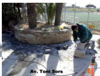
Av. Toni Sors