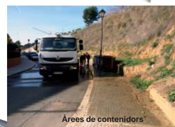
Àrees de contenidors