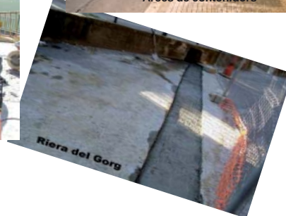
Riera del Gorg

L'Ajuntament recorda que el termini per sol·licitar la bonificació de la taxa de recollida d'escombraries, finalitza el dia 31 de març. Les persones que reuneixin les condicions per acollir-se a aquestes bonificacions ho poden sol·licitar a l'Oficina de l'Organisme de Gestió Tributària de Sant Vicenç, que trobareu a la planta baixa de l'edifici de l'Ajuntament (c/ Sant Antoni, 13), en horari de dilluns a divendres, de 9 a 14h.