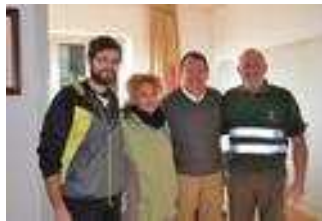
Març, 2015 . Acte de signatura del contracte de treball dels 3 santvicentns amb l'Alcalde- President de l'Ajuntament de Sant Vicenç de Montalt

Els Plans de Col.laboració Social s'han dut a terme d'abril a setembre de 2015 (6 mesos) i han permès que 3 persones aturades de llarga durada del municipi es poguessin reincorporar al mercat de treball prestant els seus serveis a la Brigada municipal.