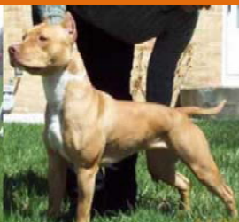
Pit Bull Terrier