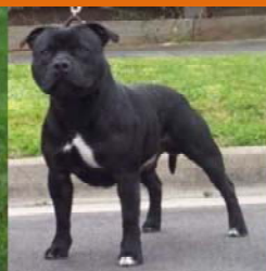
Staffordshire Bull Terrier