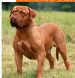
Dog de Bordeus