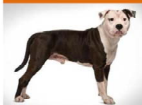
Terrier Amèrica Staffordshire