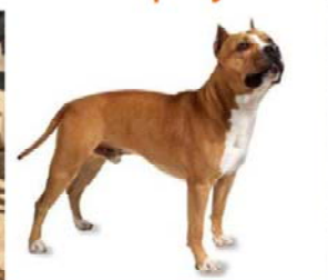
Amèrica Staffordshire Terrier