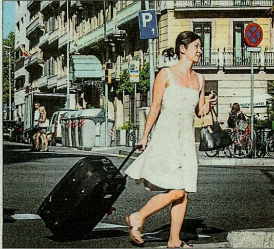
Turista al centre de Barcelona

El turisme espanyol segueix estancat després d'un any marcat per la inestabilitat