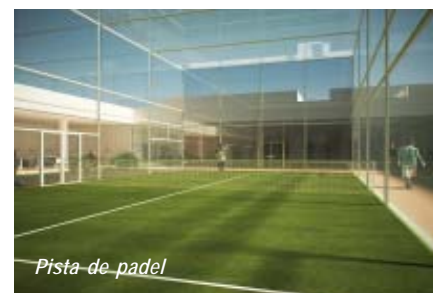
Pista de padel