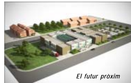
El futur pròxim