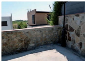
Reparació mur a "La Farrerra"