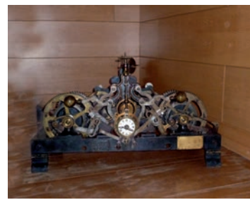
Maquinària de l'antic rellotge de l'església, col·locada al vestíbul del Centre Cívic El Gorg