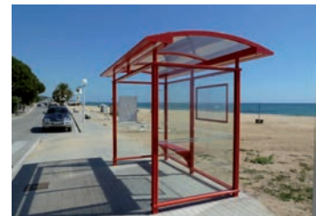
Instal·lació de dues marquesines del bus urbà al passeig marítim