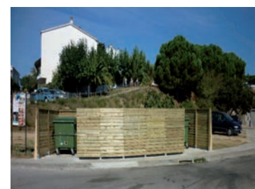
Tancament zona contenidors c/ Mossèn Jacint Verdaguer