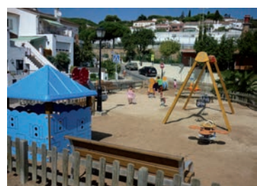
Renovació i millora del parc infantil del c/ Josep Brunet