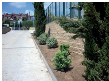
Nova zona enjardinada en la rampa d'accés a la zona esportiva des de la riera del Gorg