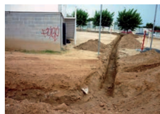
Canalització i connexió de les aigües pluvials de l'instituta la xarxa