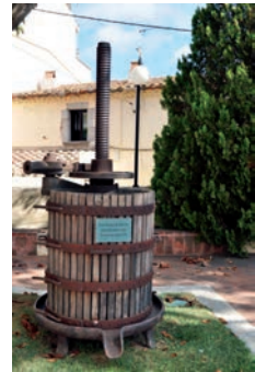
Premsa de vi del S. XX, col·locada a la plaça de l'Ajuntament