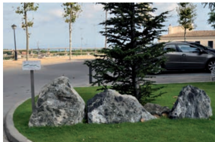
Nova zona enjardinada a la Pl. de l'església, on s'han col·locat 3 rocs que representen els 3 Turons

Tot seguit, us detallem on hem estat treballant: