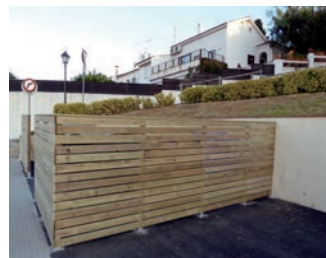
Tancament zona contenidors c/ Escoles