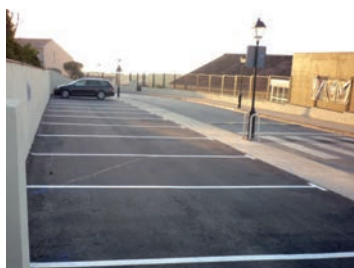
Pavimentació pàrquing c/ Escoles