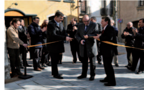
Aquesta actuació forma part del projecte de revitalització i millora del Nucli Històric, en el qual l'Ajuntament porta invertits prop d'1,5 milions d'euros.

d'1,5 milions d'euros, consisteix en diverses actuacions, destinades a regenerar el centre històric de la vila, com la urbanització i pavimentació de diversos carrers, la renovació d'una part de la xarxa d'aigua, l'enllumenat públic i el mobiliari urbà o la recuperació de fonts ornamentals. Actuacions que s'han dut a terme en els darrers cinc anys. Amb les obres d'arranjament inaugurades, la plaça del Poble esdevé el millor escenari per acollir tot tipus d'activitats i també configura un nou espai d'esbarjo, de relació i intercanvi cultural del nucli urbà.