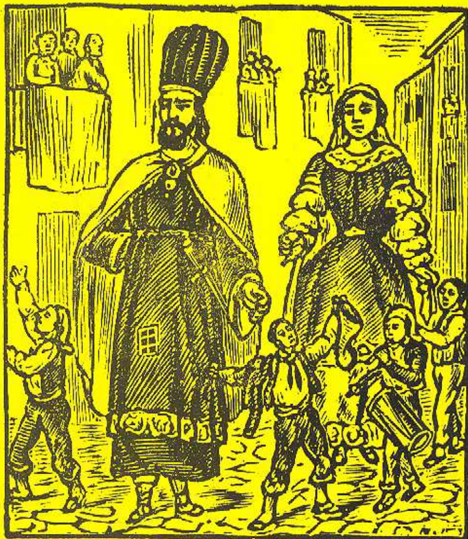
El Gegant del Pi ara balla, ara balla; El Gegant del Pi ara balla pel cant.