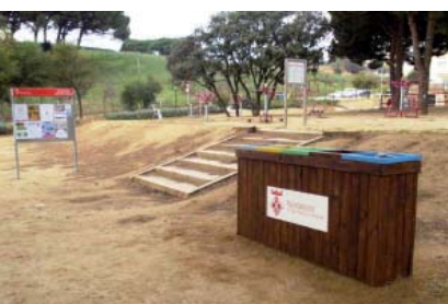
Fomentem el reciclatge

La Regidoria d'Obres i Serveis ha dut a terme diverses actuacions al municipi en l'àmbit de la millora de l'espai públic. En concret, s'han ampliat les àrees de jocs infantil dels parcs de la riera del Gorg, Germans Gabrielistes i Can Boada amb nous elements provinents de l'antic parc de l'Av. Toni Sors, on a finals del passat mes de novembre l'Ajuntament va inaugurar un parc infantil, inspirat en il·lustracions de la ninotaire Pilarín Bayés. Altra actuació destacada, ha consistit en la instal·lació de bujols per a la recollida selectiva de residus als parcs de la riera del Gorg, Terral, Can Boada, Germans Gabrielistes i Av. Toni Sors.