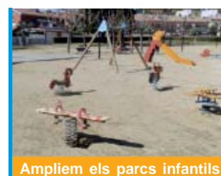
Ampliem els parcs infantils

La Regidoria d'Obres i Serveis ha dut a terme diverses actuacions al municipi en l'àmbit de la millora de l'espai públic. En concret, s'han ampliat les àrees de jocs infantil dels parcs de la riera del Gorg, Germans Gabrielistes i Can Boada amb nous elements provinents de l'antic parc de l'Av. Toni Sors, on a finals del passat mes de novembre l'Ajuntament va inaugurar un parc infantil, inspirat en il·lustracions de la ninotaire Pilarín Bayés. Altra actuació destacada, ha consistit en la instal·lació de bujols per a la recollida selectiva de residus als parcs de la riera del Gorg, Terral, Can Boada, Germans Gabrielistes i Av. Toni Sors.