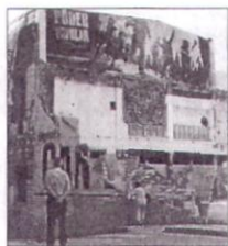
Can Vies, en el seu estat actual ■ QUIM PUIG

La campanya de micromecenatge va rebre un darrer impuls mediàtic quan dilluns es va saber que el diputat de