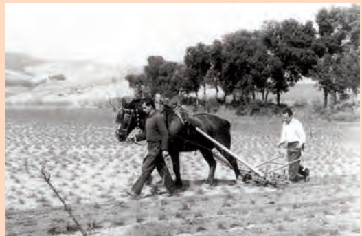
Imatges: Sant Vicenç de Montalt. Imatges d'ahir. 1900-1970