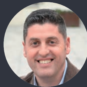
Javier Sandoval Carrillo

Amb la voluntat de garantir la màxima transparència en la gestió, l'alcalde, Javier Sandoval, es posa a disposició de la ciutadania a través del correu electrònic alcaldia@sv-montalt.cat i del programa Fil directe amb l'alcalde que emet Ràdio SantVi.