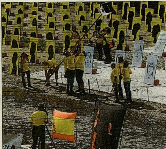
El muntatge instal·lat dissabte al riu Onyar

Els donatius són anònims, les quantitats no importen, i els voluntaris que van repartint els tiquets de reserva només faran el recompte quan tot estigui endreçat. No es parla de quantitats, però la Roser i