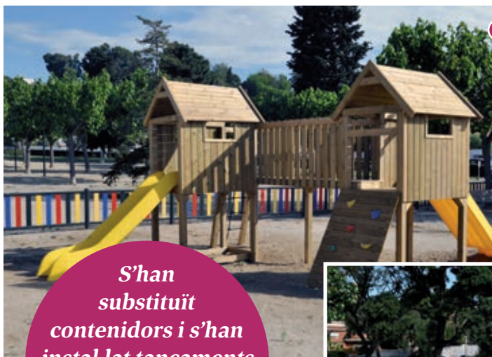
S'han instal·lat nous jocs infantils i taules de pícnic en diversos parcs del municipi.

Durant el mes de maig s'han mantingut les tasques de desinfecció de la via pública i s'han fet millores com la substitució de contenidors a les àrees de recollida selectiva del passeig dels Pins, Can Calella, Can Rams, Sant Antoni – passeig Sant Joan, Riera del Gorg, carrer Escoles i avinguda Països Catalans; el tancament amb fustes de noves àrees de contenidors i la col·locació de panells decoratius; la instal·lació de gespa artificial als parterres dels