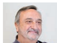
Amadeu Clofent Rosique (Junts per Catalunya)