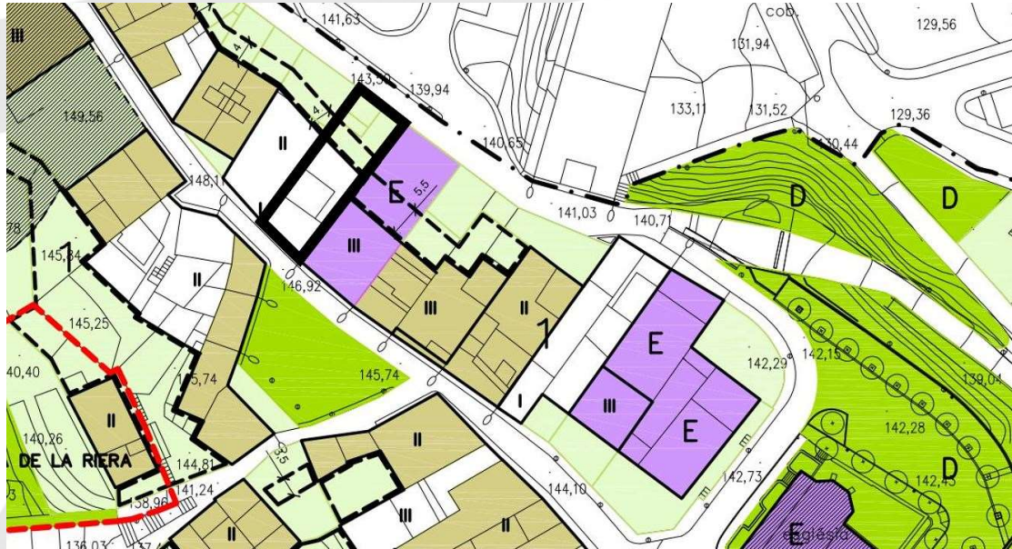
Imatge parcial del plànol núm. 7 "ordenació" de la mPERI, amb indicació del núm. 5 de la PI. del Poble.

El plànol d'ordenació en alçat del PERI estableix una alineació de la façana en planta primera reculada a 3,50m del carrer: